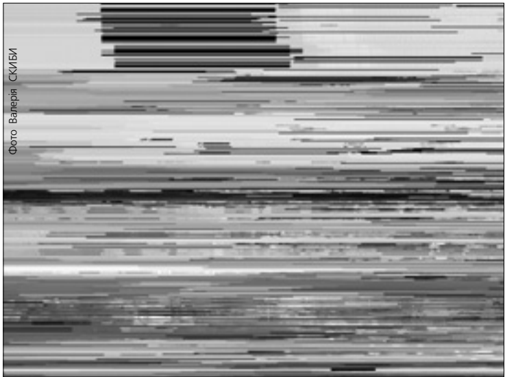
Під час зустрічі